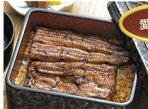
うな重「竹」肝吸い付 ¥3,400