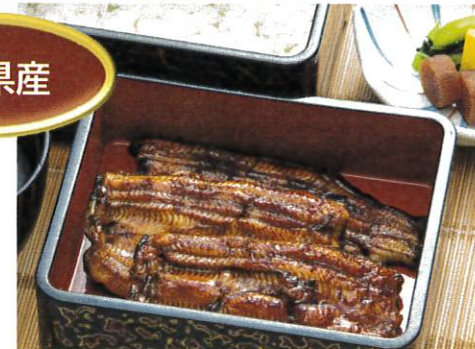
うな重「松」肝吸い付 ¥4,300