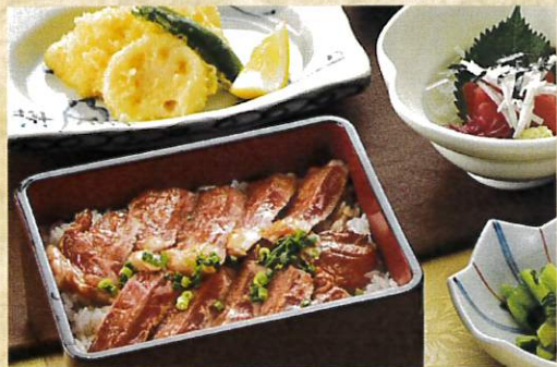
ステーキ重セット ¥1,700 鮭の山掛け・天婦羅・お新香・味噌汁付