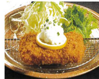
国産豚のヒレカツ 和風おろし