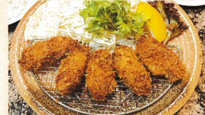
広島県呉市倉橋島産牡蠣使用 牡蠣フライ定食 ¥1,300 ライス スープ付