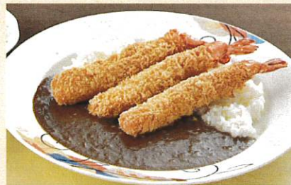
海老フライカレー ¥1,250 サラダ付