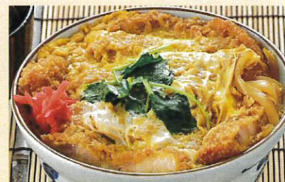
かつ丼 ¥1,100 味噌汁 お新香付