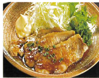
国産豚の生姜焼き