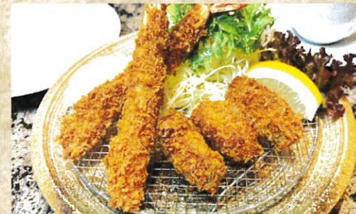
広島県呉市倉橋島産牡蠣使用 海鮮フライ定食 ¥1,350 【牡蠣・海老】 ライス・スープ付