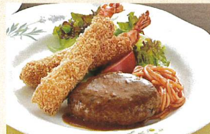
サービスランチ ¥1,100 ライス スープ付