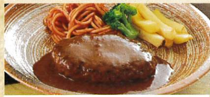
デミグラスソース 又は 和風おろし のどちらかをお選びください 手造りハンバーグ ¥1,250 ご飯 味噌汁 お新香付