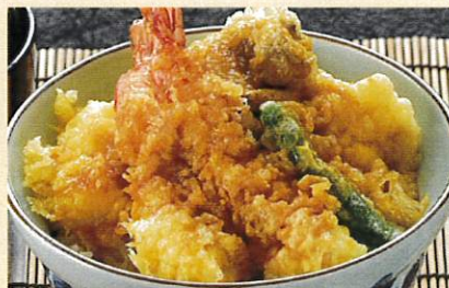
昔ながらの天丼 ¥1,250 味噌汁 お新香付