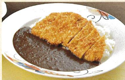
カツカレー ¥1,250 サラダ付