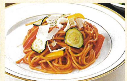
本日のパスタ ¥1,100 サラダ スープ付