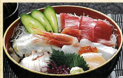
海鮮丼 ¥1,300 味噌汁 お新香付