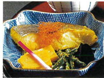
ぎんかれい 銀鯉の味噌漬焼き