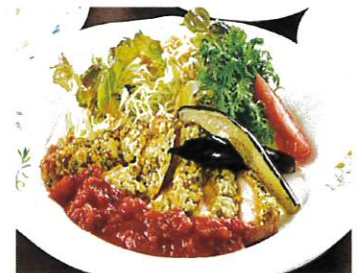
チキンの香草パン粉焼き