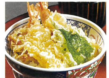
湘南しらすのかき揚げ と海老天丼