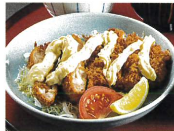
宮崎風チキン南蛮