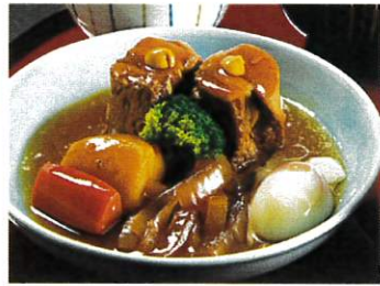
豚の角煮 温玉添え