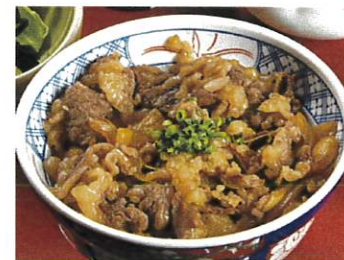
国産牛井 温玉添え