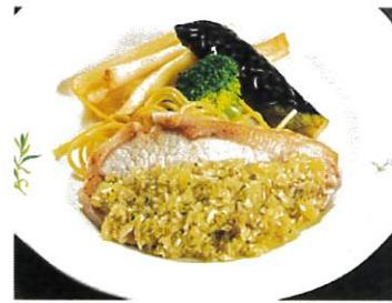
ポークソテー 和風オニオンソース