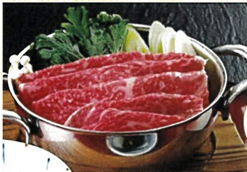
国産牛のすき鍋定食 ¥1,300