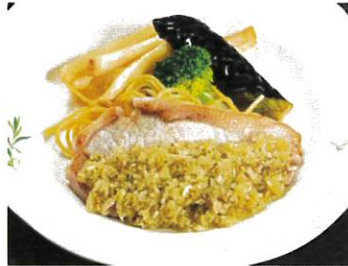
ポークソテー 和風オニオンソース