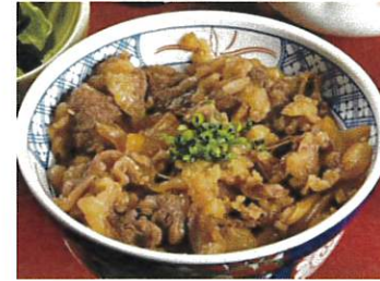
国産牛丼 温玉添え