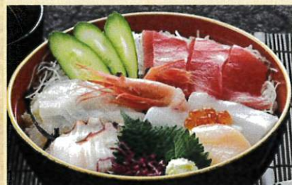
海鮮丼 ¥1,300 味噌汁 お新香付