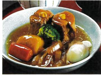
豚の角煮 温玉添え