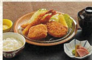
ミックスフライ定食 ¥2,000