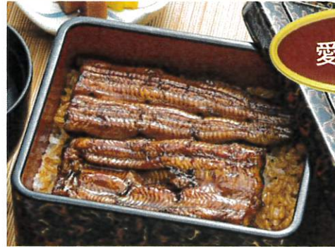
うな重「竹」肝吸い付 ¥3,400