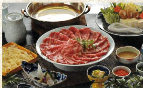
国産牛しゃぶしゃぶ御膳 ¥4,300