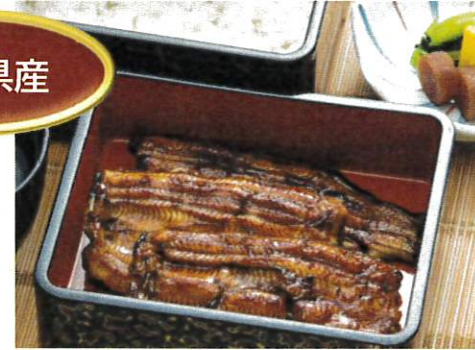
うな重「松」肝吸い付 ¥4,300