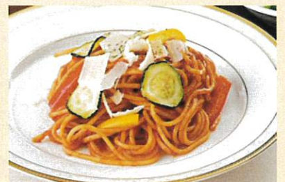
本日のパスタ ¥1,100 サラダ スープ付