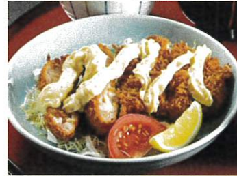
宮崎風チキン南蛮