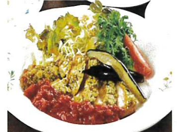
チキンの香草パン粉焼き