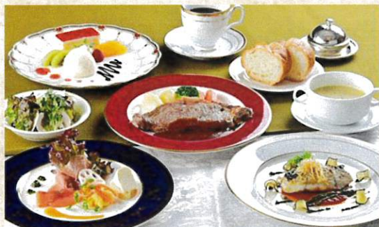
ピアッツアコース ¥4,000