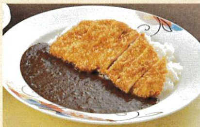
カツカレー ¥1,250 サラダ付