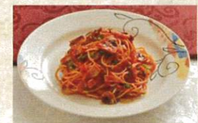
スパゲッティナポリタン ¥1,250