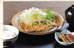
ポーク生姜焼定食 ¥2,000