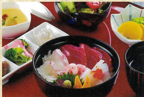
ミニ海鮮丼セット ¥1,200 小鉢3種盛・茶碗蒸し・サラダ・お新香・味噌汁付