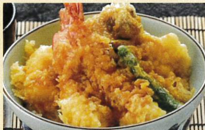
昔ながらの天丼 ¥1,250 味噌汁 お新香付