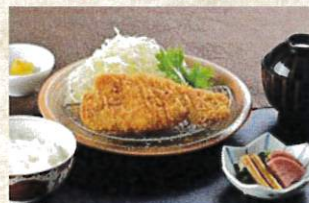
国産豚ロースカツ定食 ¥2,000