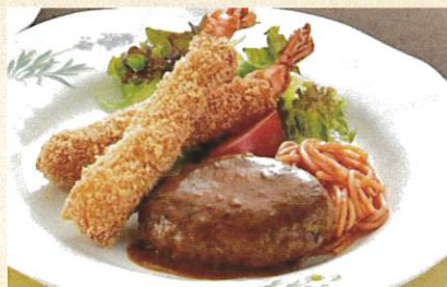
サービスランチ ¥1,100 ライス スープ付