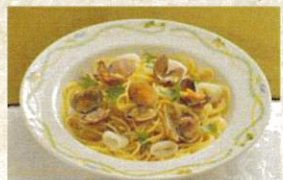
スパゲッティ ボンゴレ ¥1,250