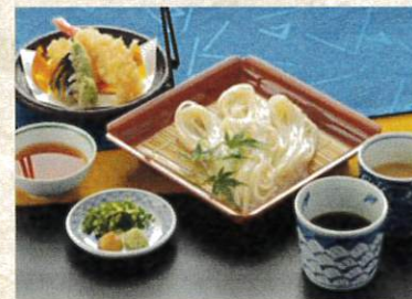
天婦羅稲庭うどん ¥1,450