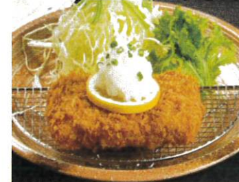
国産豚のヒレカツ 和風おろし