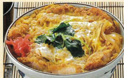
かつ丼 ¥1,100 味噌汁 お新香付