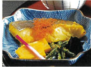
ぎんかれい 銀鯉の味噌漬焼き