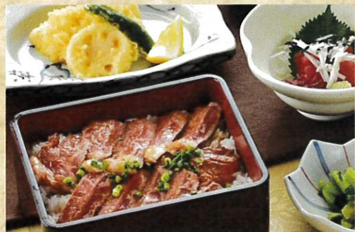
ステーキ重セット ¥1,700 鮭の山掛け・天婦羅・お新香・味噌汁付