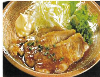
国産豚の生姜焼き