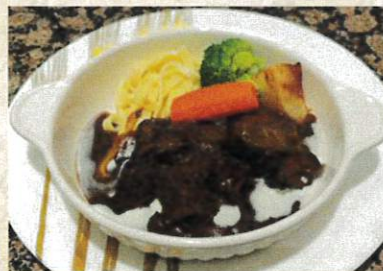
ビーフシチューセット ¥3,500