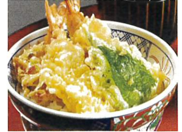
湘南しらすのかき揚げ と海老天丼